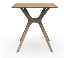
Mesa Compacto Fenolico 70x70 Roble Nat. Pie Vela &quot;S&quot; Arena 04062..1X.