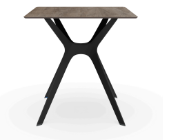
Mesa Compacto Fenolico 70x70 Roble Cen. Pie Vela &quot;S&quot; Negro 04058..1X.