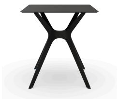
Mesa Compacto Fenolico 70x70 Negra Pie Vela &quot;S&quot; Negro 03059..1X.