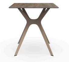
Mesa Compacto Fenolico 70x70 Roble Cen. Pie Vela &quot;S&quot; Arena 04061..1X.