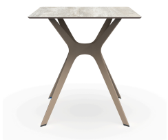
Mesa Compacto Fenolico 70x70 Madera Lav. Pie Vela &quot;S&quot; Arena 04060..1X.