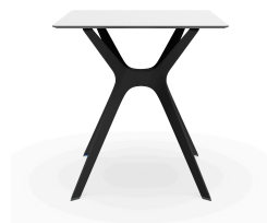
Mesa Compacto Fenolico 70x70 Blanca Pie Vela &quot;S&quot; Negro 03058..1X.