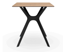
Mesa Compacto Fenolico 70x70 Roble Nat. Pie Vela &quot;S&quot; Negro 04059..1X.