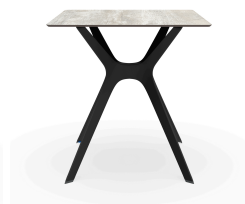
Mesa Compacto Fenolico 70x70 Madera Lav. Pie Vela &quot;S&quot; Negro 04057..1X.