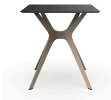
Mesa Compacto Fenolico 70x70 Blanca Pie Vela &quot;S&quot; Arena 03062..1X.