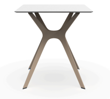
Mesa Compacto Fenolico 70x70 Blanca Pie Vela &quot;S&quot; Arena 03061..1X.