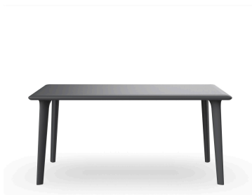
Mesa New Dessa 160x90 Gris Oscuro 03946..1X.