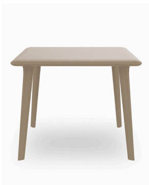
Mesa New Dessa 90x90 Arena 03945..1X.