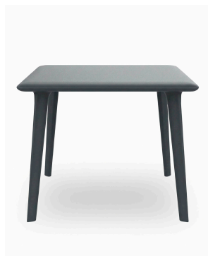
Mesa Dessa 90x90 Gris Oscuro 03944..1X.