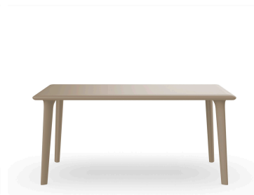
Mesa Dessa 160x90 Arena 03947..1X.