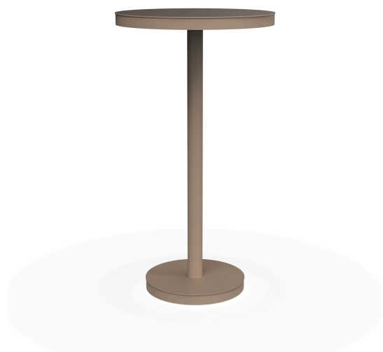
Mesa Barcino Ø60 Pie Central Alto Arena 01433..1X.