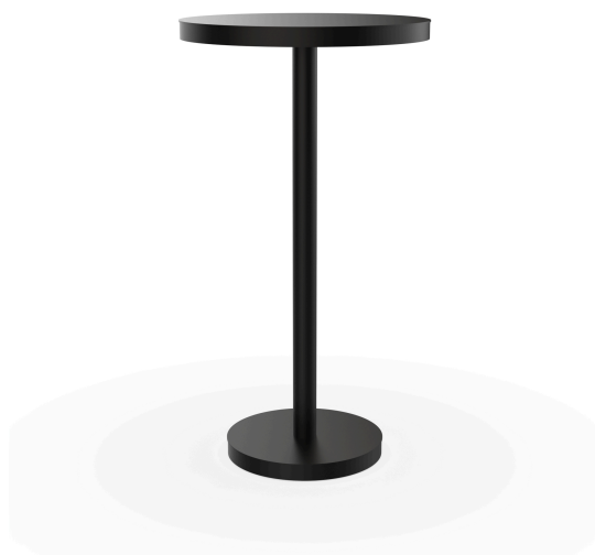
Mesa Barcino Ø60 Pie Central Alto Negra 01434..1X.