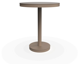
Mesa Barcino Ø60 Pie Central Arena 01431..1X.