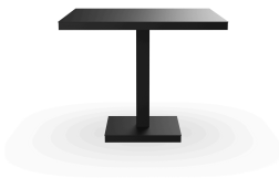
Mesa Barcino 90x90 Pie Central Negra 01422..1X.