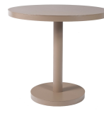
Mesa Barcino Ø80 Pie Central Arena 01423..1X.