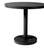
Mesa Barcino Ø80 Pie Central Negra 01424..1X.