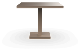
Mesa Barcino 90x90 Pie Central Arena 01421..1X.