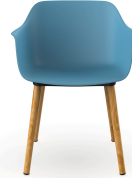
Silla Shape Wood Azul Retro 05313..2X.