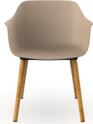
Silla Shape Wood Arena 05311..2X.