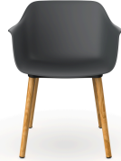
Silla Shape Wood Gris Oscuro 05312..2X.