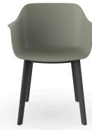
Silla Shape Gris Verdoso patas Click 05462..2X.