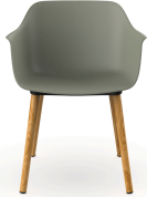
Silla Shape Wood Gris Verdoso 05310..2X.