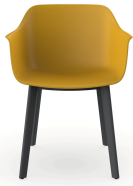
Silla Shape Toscano patas Click 05193..2X.