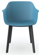
Silla Shape Azul retro patas Click 05460..2X.