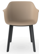
Silla Shape Arena patas Click 05461..2X.