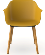
Silla Shape Wood Toscano 05314..2X.