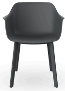
Silla Shape Gris Oscuro patas Click 05191..2X.