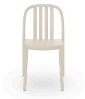
Silla Sue Lamas Marfil 07141..4X.