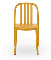
Silla Sue Lamas Toscano 05171..4X.