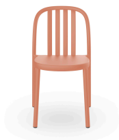
Silla Sue Lamas Terra Cotta 05172..4X.