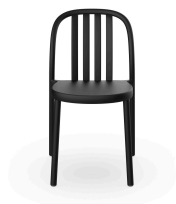
Silla Sue Lamas Negra 05168..4X.