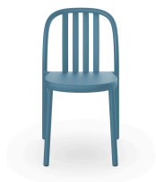
Silla Sue Lamas Azul Retro 05170..4X.