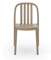
Silla Sue Lamas Arena 05169..4X.