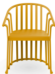
Sillon Raff Toscano 04912..4X.