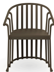
Sillon Raff Chocolate 04913..4X.