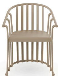
Sillon Raff Arena 04908..4X.