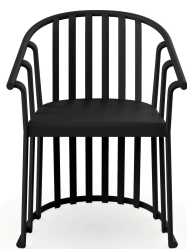
Sillon Raff Negro 04909..4X.