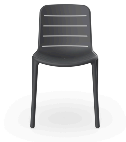
Silla Gina Gris Oscuro 06461..4X.