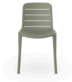
Silla Gina Gris Verdoso 06462..4X.