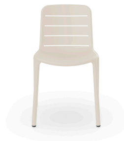
Silla Gina Marfil 07143..4X.