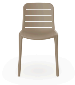
Silla Gina Arena 03498..4X.