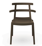
Silla Tokyo Chocolate 01621..4X.