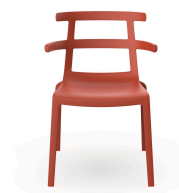
Silla Tokyo Greda 07207..4X.