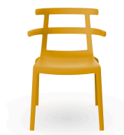
Silla Tokyo Toscano 01624..4X.