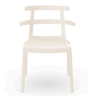
Silla Tokyo Nuevo Marfil 01617..4X.