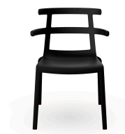
Silla Tokyo Negra 01626..4X.