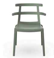
Silla Tokyo Gris Verdoso 01620..4X.