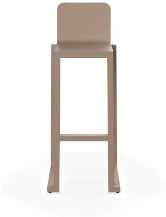
Taburete Barcino Arena 01397..2X.