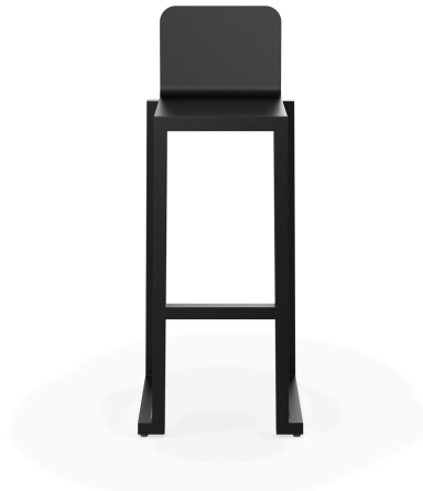
Taburete Barcino Negro 01398..2X.