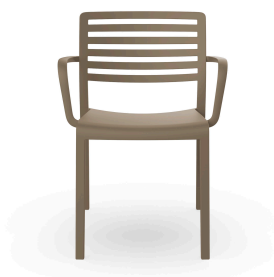
Silla Con Brazos Lama Arena 01326..4X.