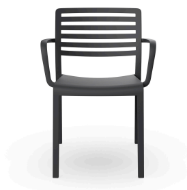
Silla Con Brazos Lama Gris Oscuro 01785..4X.