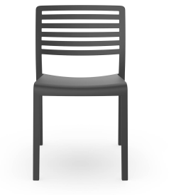
Silla Lama Gris Oscuro 01784..4X.