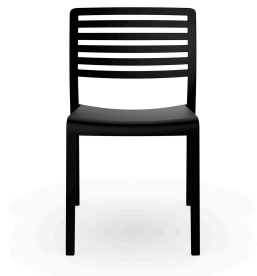
Silla Lama Negro 00866..4X.