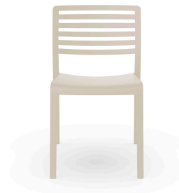
Silla Lama Marfil 07039..4X.