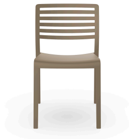
Silla Lama Arena 01336..4X.